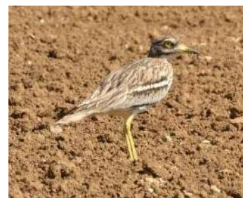
Œdicnème criard